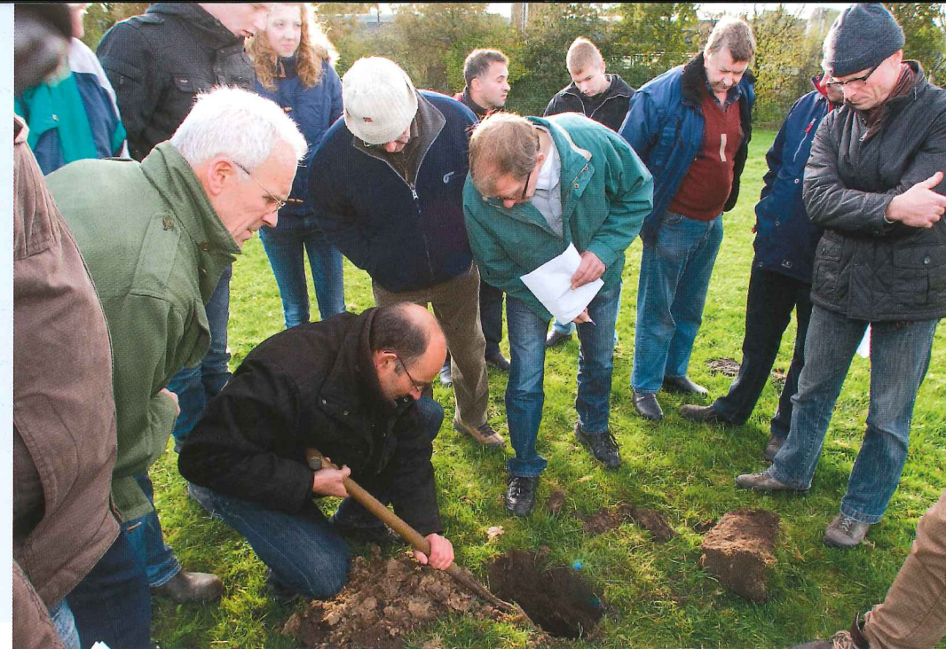
Klaver is voor de meeste biologische melkveebedrijven een belangrijke stikstofbron.